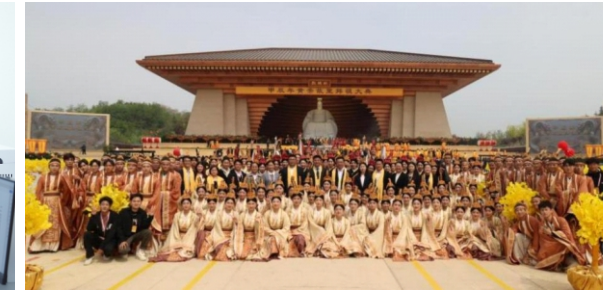
学生参与黄帝故里拜祖大典志愿服务活动